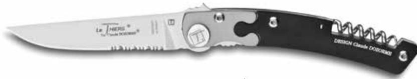
Thiers tire-bouchon | Thiers corkscrew CF 12 cm, CO 22 cm, L 9,5 cm 1.90.129.23