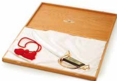
Coffret chêne Oak box with empty space for bottle 5.11.063.--