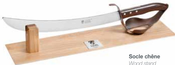
Socle chêne Wood stand 9.94.063.--