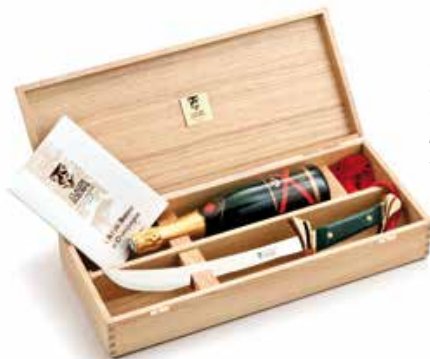
Coffret chêne avec emplacement pour bouteille Oak box with empty space for bottle 5.94.209.--