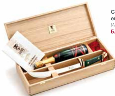
Coffret chêne avec emplacement pour bouteille Wood stand 5.11.209.--