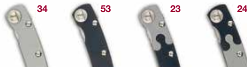
34 Gris - Grey 23 Gris-Noir - Grey-Black 53 Noir - Black 24 Noir-Gris - Black-Grey