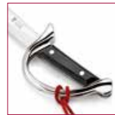
90 Mac Mahon