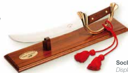
Socle acajou Display stand 9.11.063.--